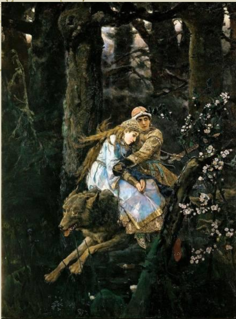
Иван Царевич на сером волке